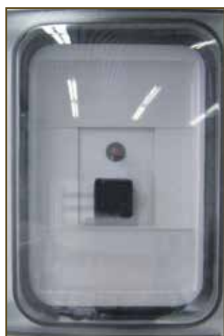
Hlavní ovládací modul